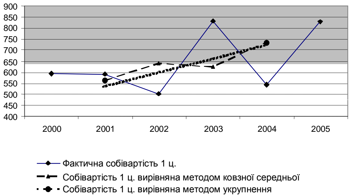
Рисунок 2.1. Вирівнювання собівартості 1 ц. продукції свинарства методом укрупнення періодів та методом ковзної середньої